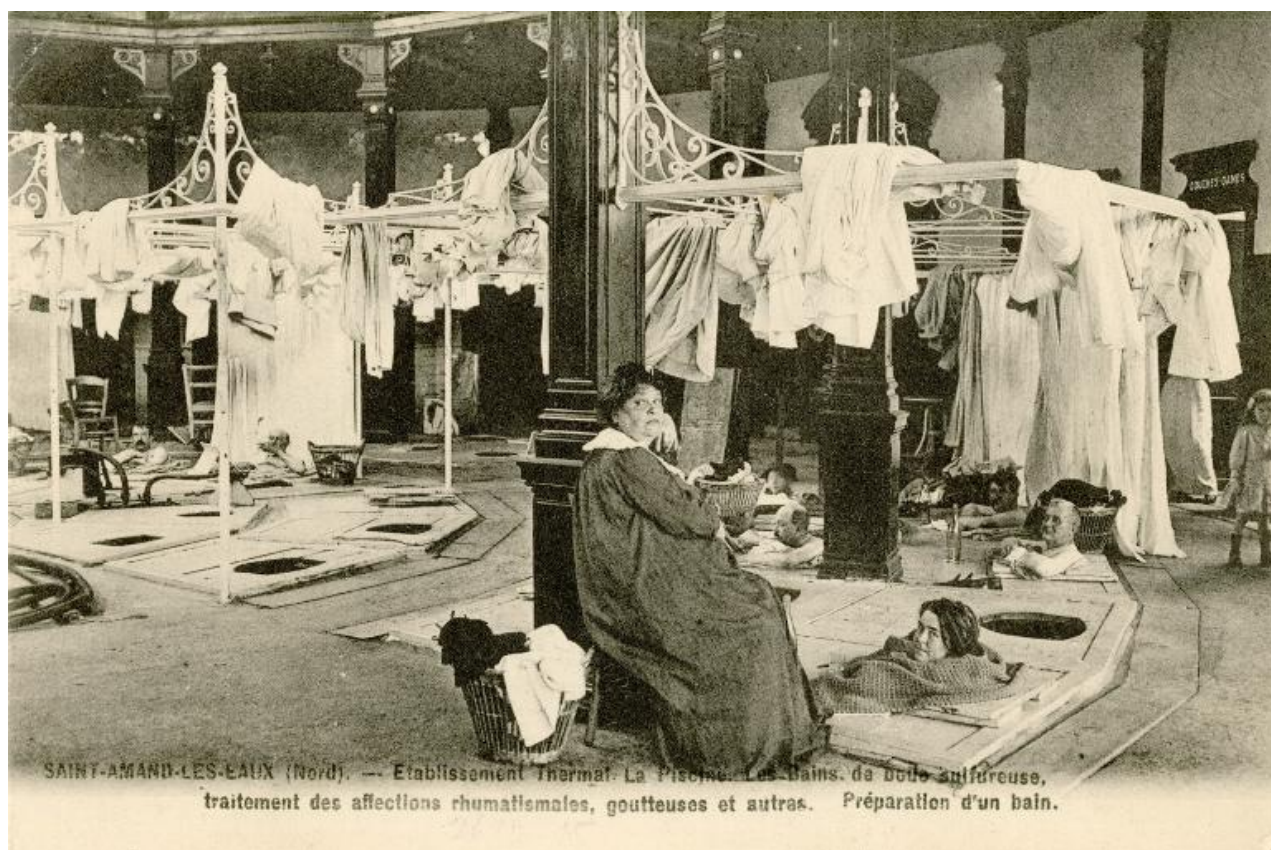
L'intérieur de la rotonde des boues, carte postale, sans date, IVR (Inventaire Hauts-de-France) Côte IVR31_20155908010NUCA Conservée à la Médiathèque, Saint-Amand-Les-Eaux https://inventaire.hautsdefrance.fr/illustration/IVR31_20155908010NUCA