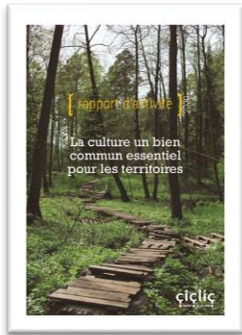
Le rapport d'activité 2021.

→ Le repérage des enjeux et des principes directeurs de l'établissement évite une approche trop technique, voire technocratique, du projet stratégique de l'établissement