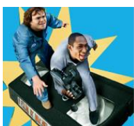
Soyez sympas, rembobinez film réalisé par Michel Gondry