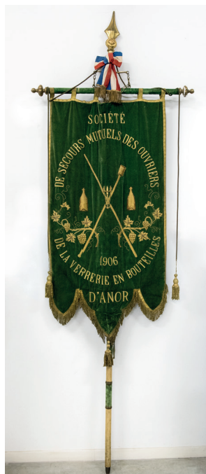
Bannière de procession de la Société de secours mutuels des ouvriers de la verrerie en bouteilles d'Anor

date : 1880 – 1922 / lieu de fabrication : Pas-de-Calais / technique : verre blanc épais soufflé-moulé avec un coq en relief