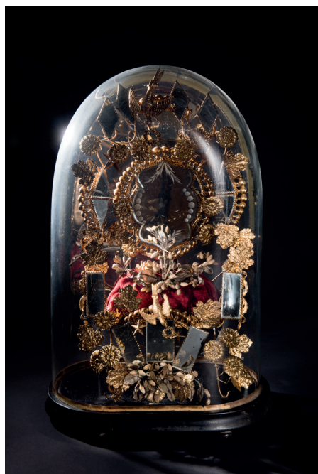
Globe de mariée

technique : plaques en verre blanc trempé sérigraphié, socle en verre moulé