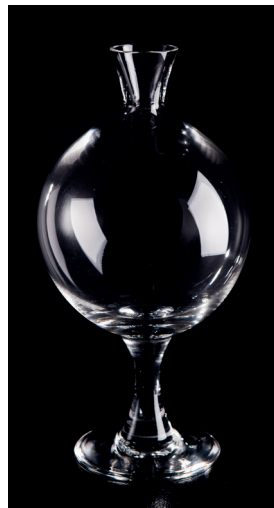
Loupe de dentellière

Intérêt : Grève dans les verreries à cause de la mécanisation (lien Fourmies ?)