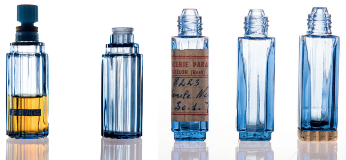
Flacon « Je reviens »

technique : globe en verre blanc soufflé, socle en bois, calotte horizontale en velours, décoration en cuivre embouti et doré, fleurs d'oranger en cire et miroirs