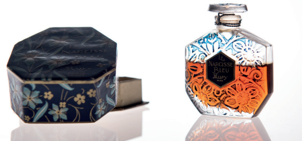
Flacon de parfum « Le Narcisse bleu » et sa boîte

Intérêt : prétexte à évoquer verreries noires de Fourmies et / ou de Trélon.