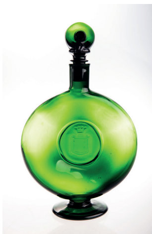
Flacon d'armagnac avec pied et bouchon chapeau de mousquetaire

technique : verre filé, garde et lame rapportées à chaud