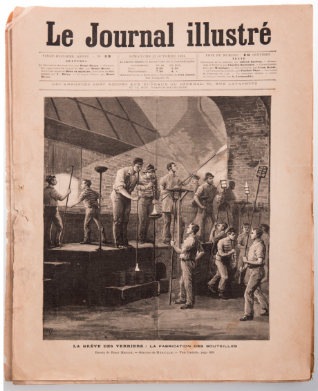
La grève des verriers : la fabrication des bouteilles. Le journal illustré, n°43

date : dimanche 25 octobre 1891 / technique : papier