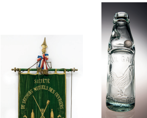
Bouteille à bille

Intérêt : d'autres exemplaires en réserve.