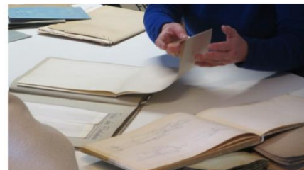
Speed-dating patrimonial sur les archives textiles conservées à la Médiathèque la Grand-Plage