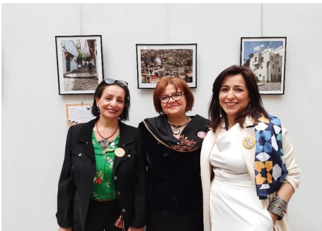
Vernissage d'exposition de photographies architecturales