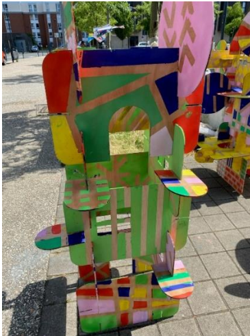
Atelier peinture avec des enfants

Le temps de la participation de « 2024, année des danses du monde » aura lieu du 10 au 31 Mai 2024 . Si vous souhaitez déposer un projet dans le cadre de ce temps fort, la restitution de votre travail doit donc se dérouler pendant cette période. Les ateliers, quant à eux, peuvent se dérouler librement lors des jours, semaines et mois précédents.