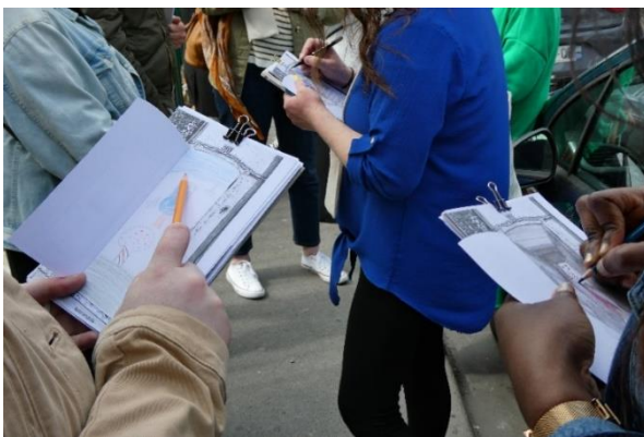
Visite dessinée du quartier de l'Hommelet