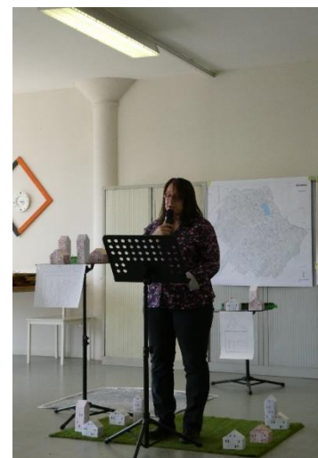
Restitution d'atelier d'écriture