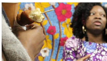
Ciné-débat autour des textiles afro-caribéens centré sur le monopole du WAX par l'association KERA à la Troisième Place