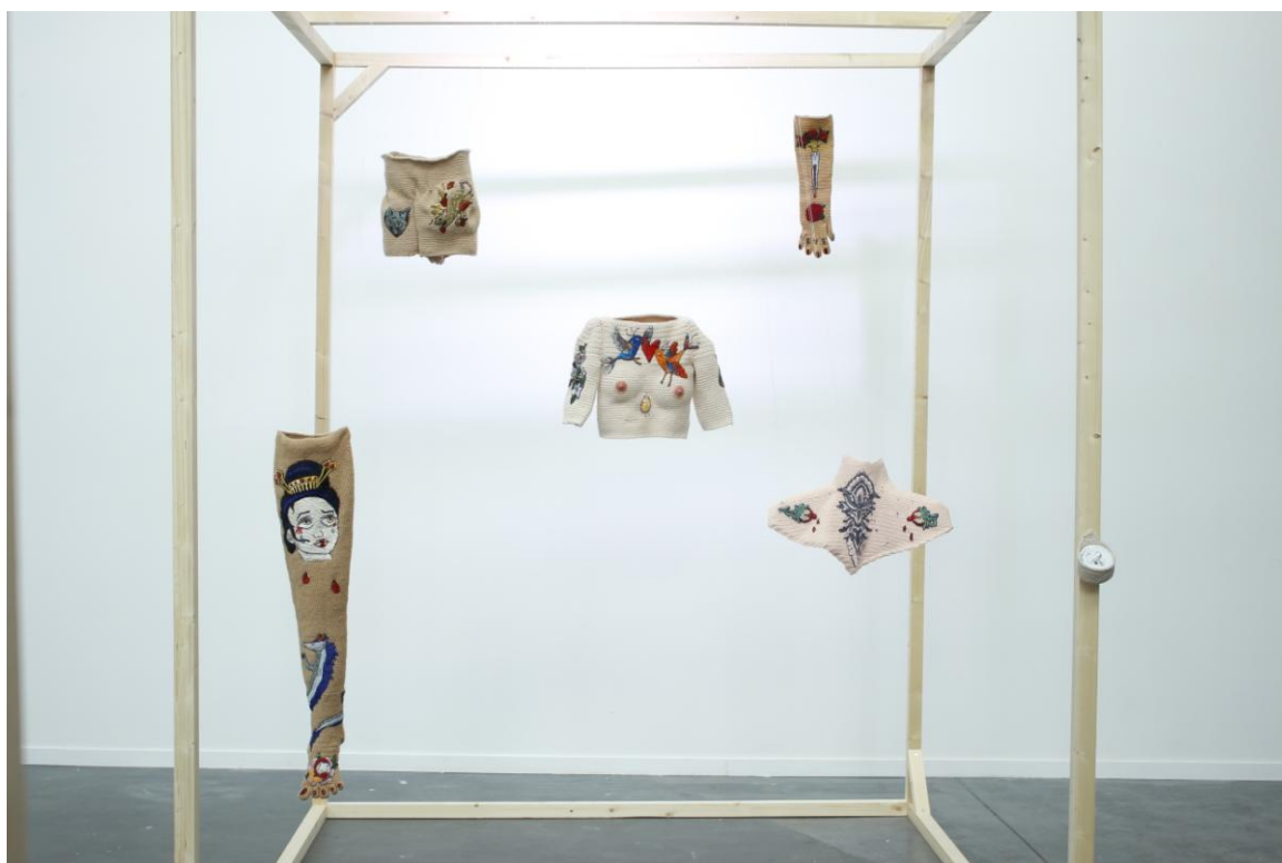
Julie Burton, vue d'exposition, biennale Objet Textile, 2018